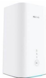
Huawei H122-373 Cube Box (5G) + Carte eSIMsmart Consignes d'utilisation