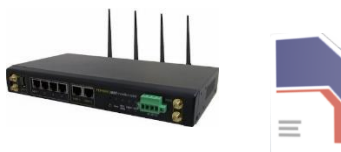
Pepwave HD2 + Carte Sim Bouygues Consignes d'utilisation