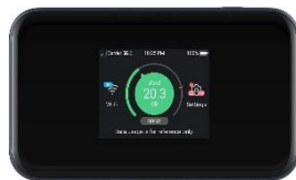
ZTE MU5001 Wi-Fi Hotspot (5G) Consignes d'utilisation